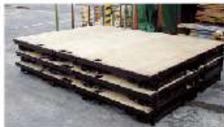
フォールドデッキ組み立て前