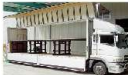
フォールドデッキ組み立て

特徴・性能 パレットを2段に積む事ができるため輸送効率がアップ。フォークリフトを使用してトラック荷台上で簡単に組み立てできます。折りたたんだ状態でも荷物を積載することができます。(保管がカンタン) ユーザートラック(ウイング車)のサイズに合わせたオーダー製造ができます。積載許容重量 2000kg/台(標準仕様)。