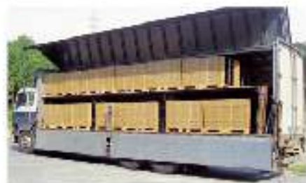
2倍の積載量が可能